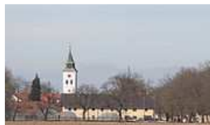
Heiligkreuz Kirche, Freiham

Nach Eröffnung und Präsentation der Ausstellung wird im ESV Neuauubing der "St. Patrick's Day" mit Live Musik gefeiert.